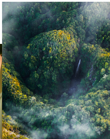
Joanna Lasowska. Fotograf