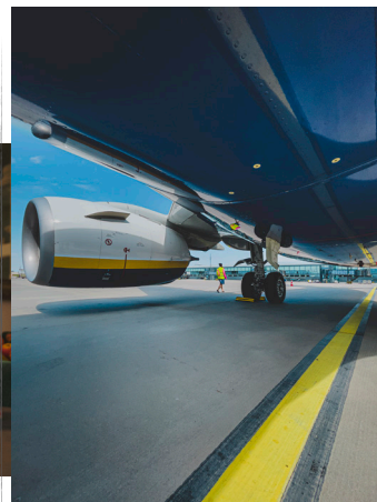
Adrian Werner. Fotograf